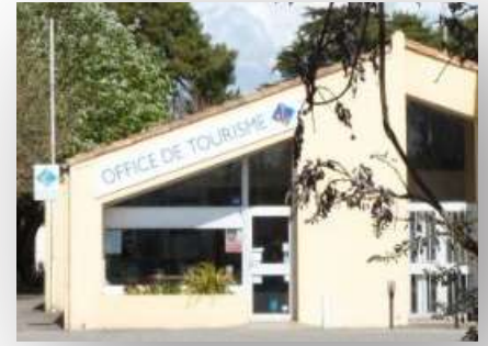
Ci-contre, l'Office de Tourisme (ancien emplacement)

L'adaptation du Canopus aux besoins des utilisateurs.